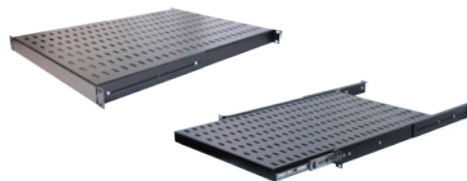
Tablettes: fixes, coulissantes à 4 points de montage