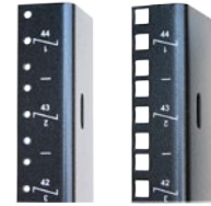
Rails de montage E.I.A.