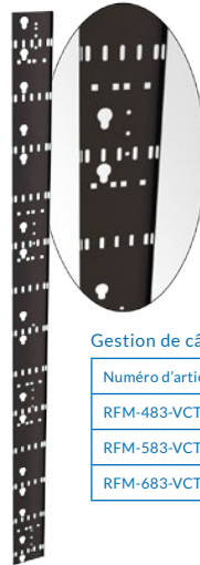
Gestion de câbles à la verticale