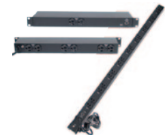
Barre d'alimentation – horizontale et verticale